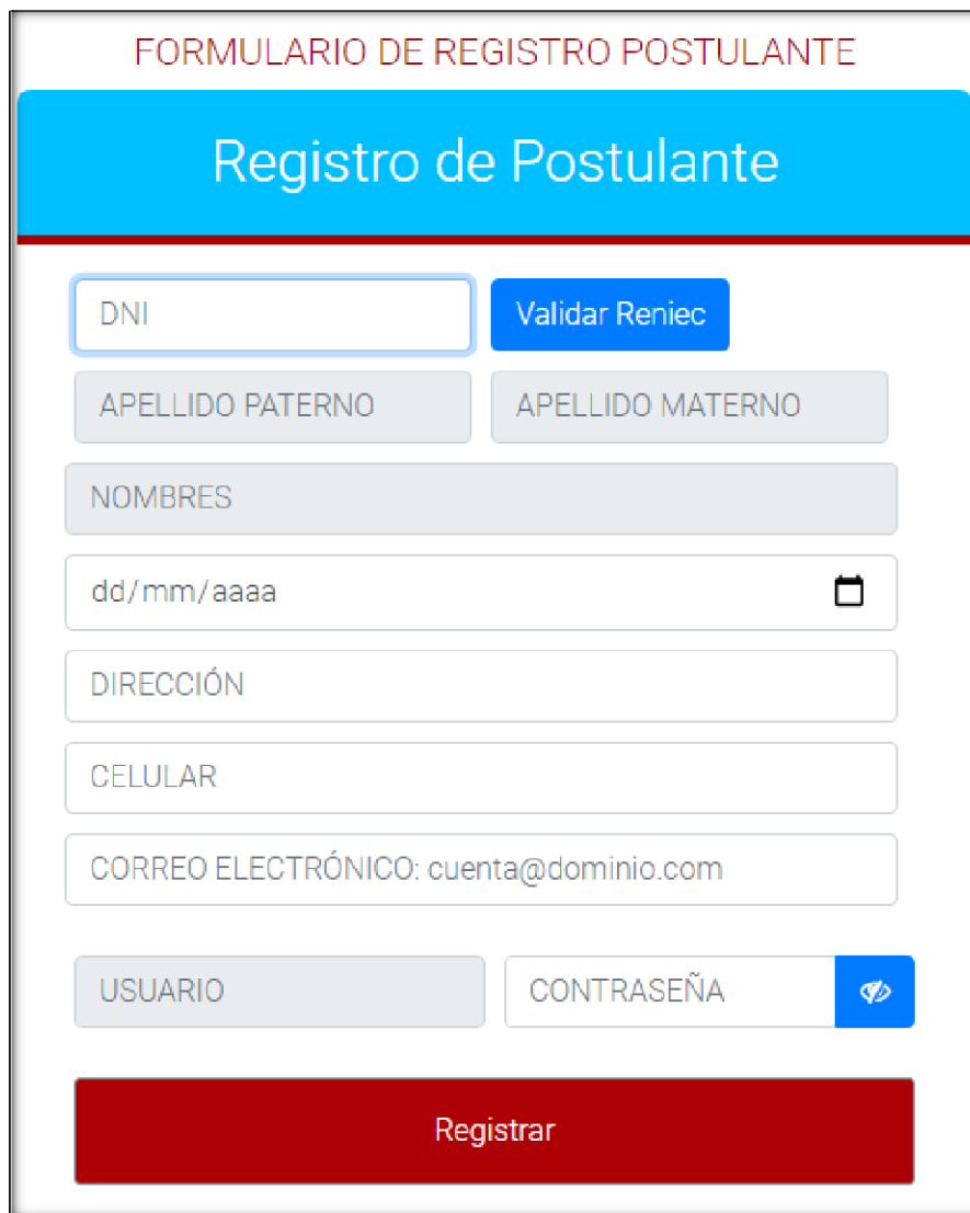
Imagen 02: Formulario para registro de los postulantes

la bandeja de entrada, pero de no ser el caso, revise en la bandeja de correos no deseados.