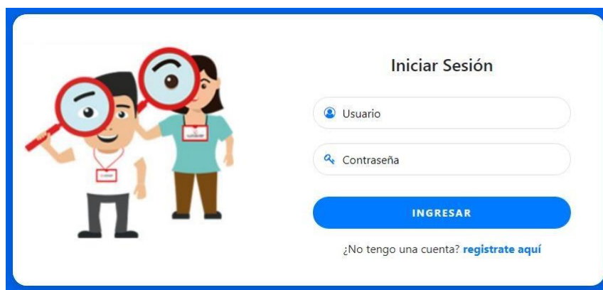
Imagen 01: Acceso al aplicativo convocaCAS

Para acceder al aplicativo deberá contar con un usuario y contraseña, los mismo que digitará para poder iniciar sesión, sino tuviera una cuenta deberá crear una, haciendo clic en el link regístrate aquí , como se observa en la imagen 01